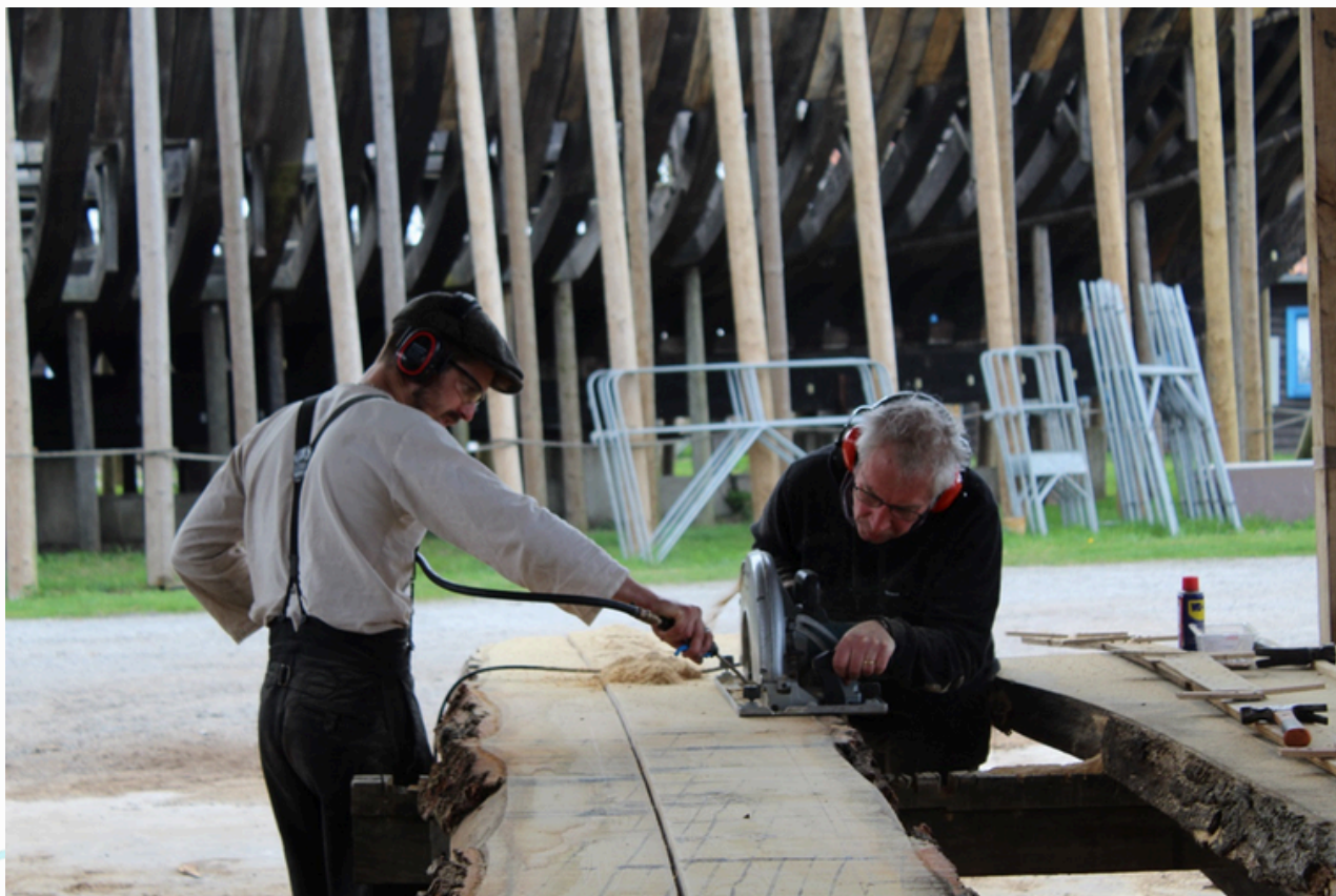
Découpe du vaigre à la scie circulaire