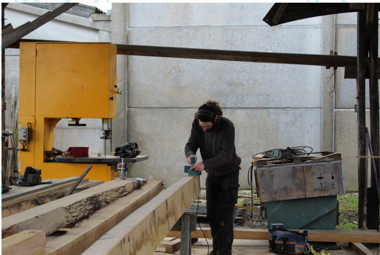
Rabotage des champs du vaigre afin de lui donner son équerrage définitif