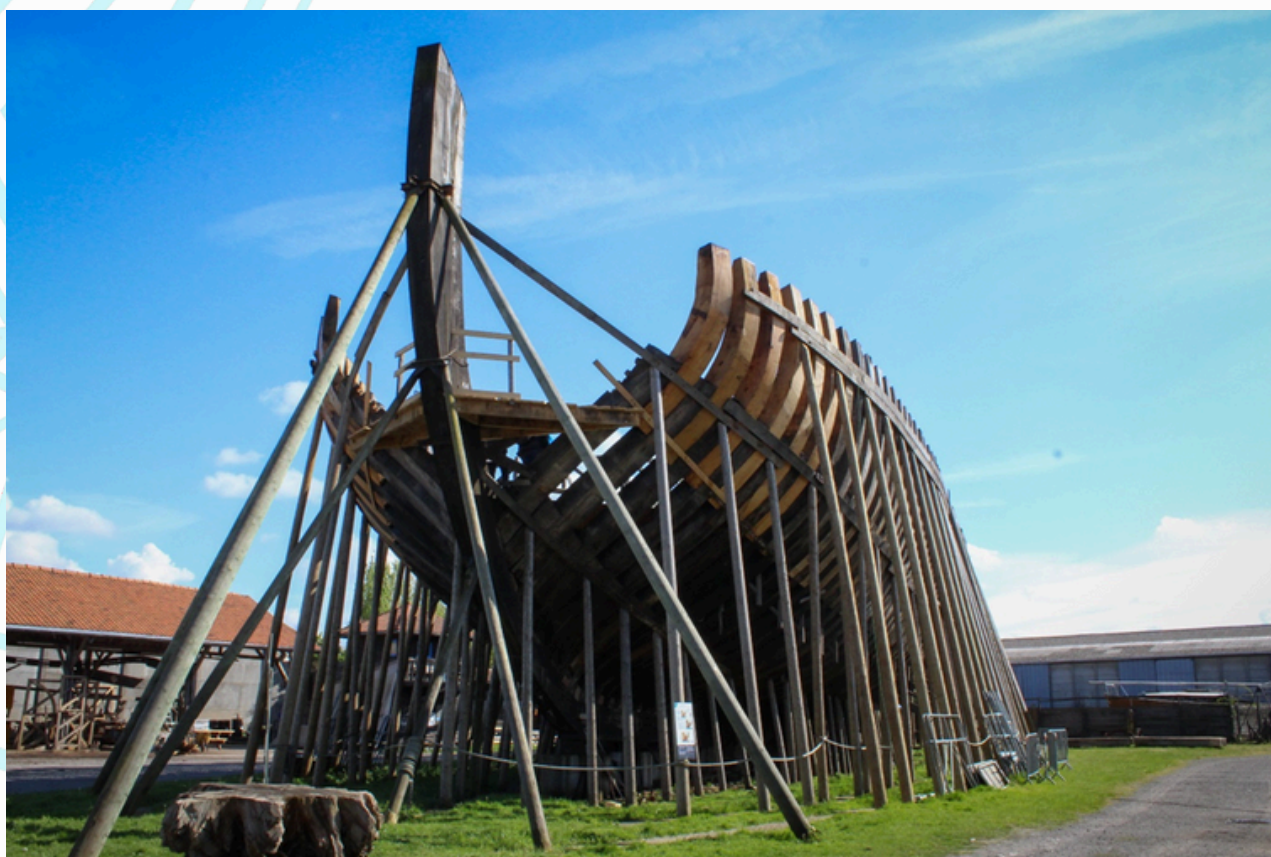
Vue de l'extérieur du navire avec les dernières premières allonges terminées.