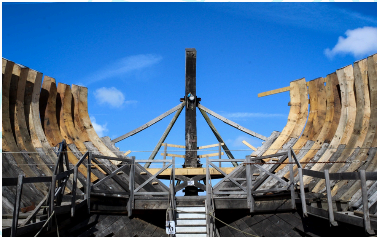
Vue de l'intérieur du navire avec les dernières premières allonges terminées.